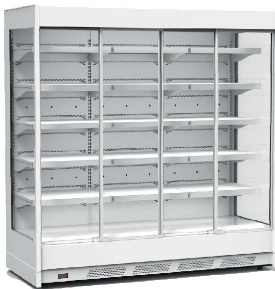
wersja: boki - szyba zespolona lakierowana, drzwi przesuwne