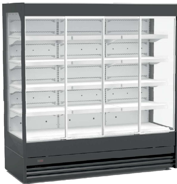
wersja: boki - szyba zespolona lakierowana, drzwi przesuwne